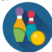
Pakiet JĘZYK ANGIELSKI 100