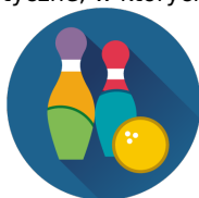
Pakiet PLAY 50