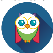
Pakiet EDU 50

FunFloor Edu zawiera 4 pakiety tematyczne, w których jest razem 210 gier: