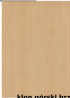
klon górski brzoza