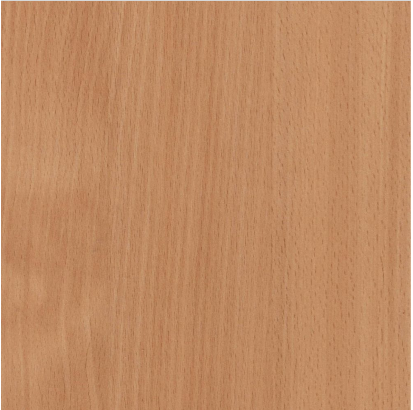
Buk bawaria STANDARD

Łęczyńska 37, 20-309 Lublin, NIP 7120165368, REGON 430362055 Nr tel. 81 525 85 51, Nr faks 81 525 86 93 E-mail: cezas@cezas.com.pl